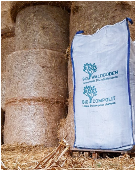
Im Vergleich zu Stroh muss weniger Lagerfläche für Bio-Waldboden vorgehalten werden.

menge zwischen 10 und 13 Big-Bags sinken die Kosten auf 175 Euro pro Einheit. Bestellt man zwischen 18 und 28 Big-Bags kostet das Stück nur noch 160 Euro. Die mengen- und entfernungsabhängig Kosten kann man unter https://www.bio-waldboden.de/bestell-formular unverbindlich kalkulieren. Hier steht auch ein Grundeinstreurechner (orangefarbener runder Button) zur Verfügung, um die vorab den Mengenbedarf zu ermitteln.