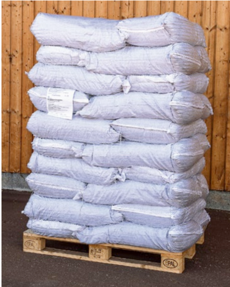
Geliefert wird Bio-Waldboden entweder in Big-Bags oder in Paletten mit je 30 Säcken Einstreu.