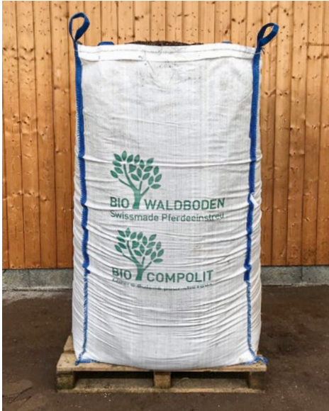
Bio-Waldboden wird in Big-Bags (2.000 Liter) oder alternativ in 70-Liter-Säcken angeboten.