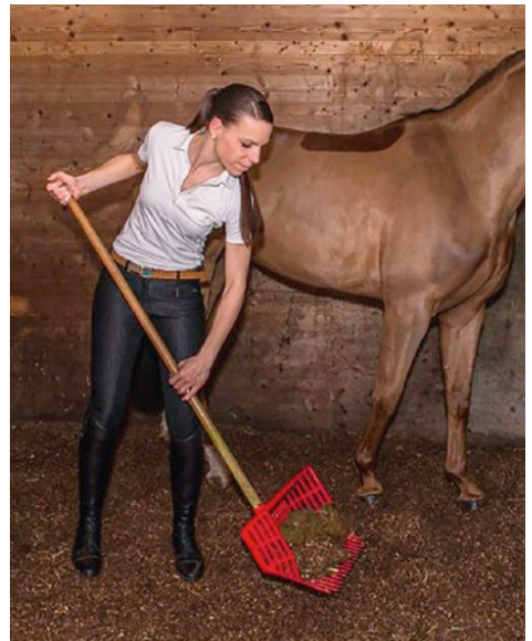
Es müssen nur die Pferdeäpfel abgesammelt werden. Urin wird durch einen mikrobiologischen Vorgang in der Einstreusicht neutralisiert.

Falls sich die obere Schicht verhärtet, sollte diese oberflächlich aufgelockert werden. Zum Beispiel mit einem robusten Rechen. In der Praxis haben sich auch Akku-Garten-