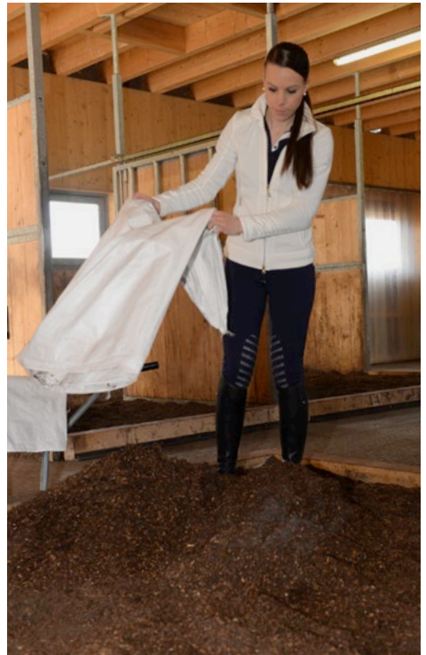
Für die Grundeinstreu sollte Bio-Waldboden mit einer Höhe von 20 cm eingestreut werden.

raum unter Berücksichtigung der geringeren Aufwendungen durch Bio-Waldboden (Zeitersparnis, geringeres Entsorgungsvolumen, Tierwohl, etc.) machen und die anfänglichen Investitionskosten ausklammern. ►